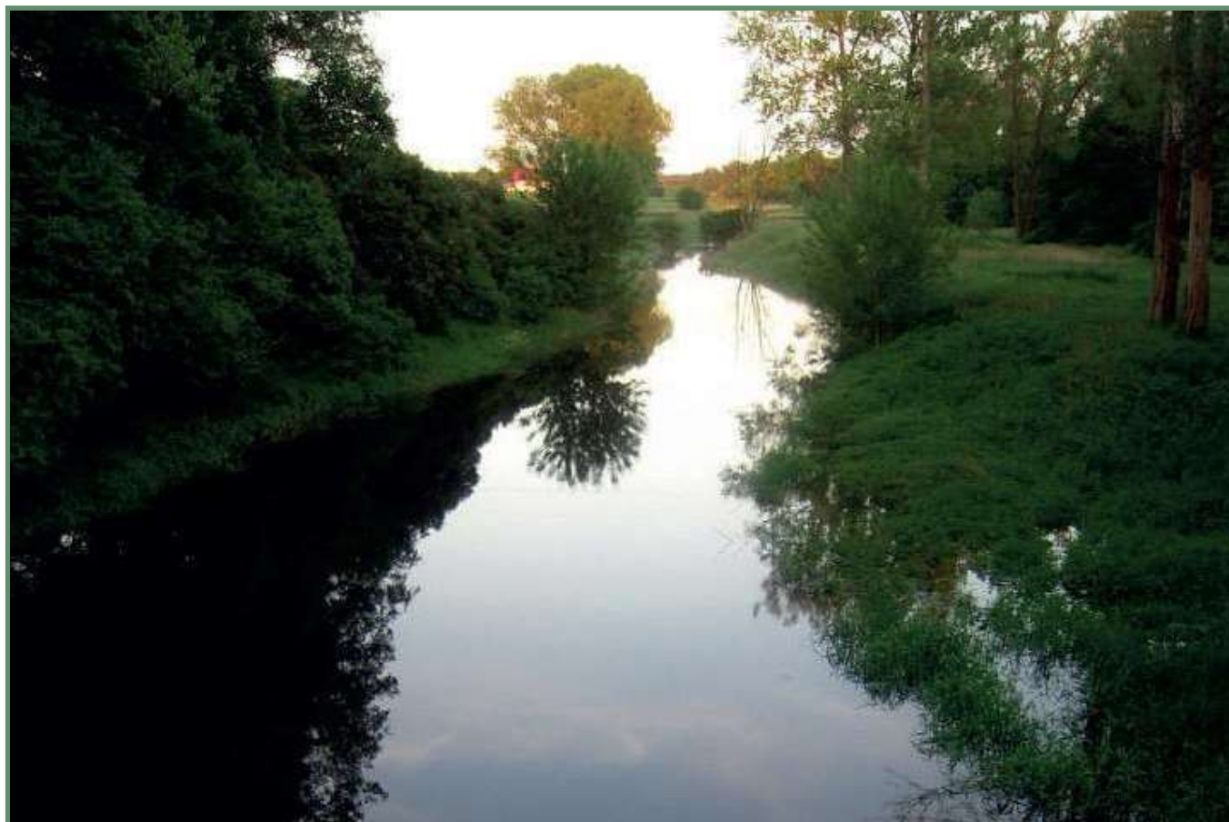
Rzeka Sama

Podsumowując można stwierdzić, iż obszar jest spójny, posiada scalające elementy, jest dobrze skomunikowany. To, że partnerstwo przetrwało, pomimo braku finansowania LSR na lata 2014-2020 i gminy członkowskie oraz pozostali członkowie nie zainicjowali przyłączenia do sąsiednich LGD, jest najlepszym argumentem, iż jest to właściwe partnerstwo, które mając podobne zasoby, chce osiągnąć wspólne cele.