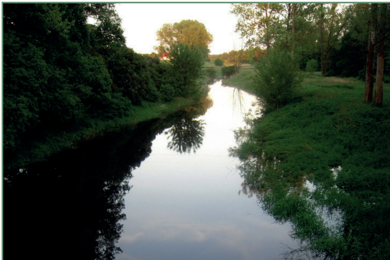
Rzeka Sama

Podsumowując można stwierdzić, iż obszar jest spójny, posiada scalające elementy, jest dobrze skomunikowany. To, że partnerstwo przetrwało, pomimo braku finansowania LSR na lata 2014-2020 i gminy członkowskie oraz pozostali członkowie nie zainicjowali przyłączania do sąsiednich LGD, jest najlepszym argumentem, iż jest to właściwe partnerstwo, które mając podobne zasoby, chce osiągnąć wspólne cele.